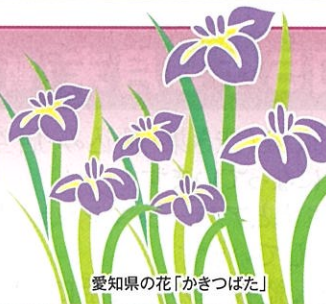
愛知県の花「かぎつばた」

発行所：(公社)愛知県防犯協会連合会 名古屋市昭和区円上町26番15号 (愛知県高辻センター 2階) (052) 871-2110